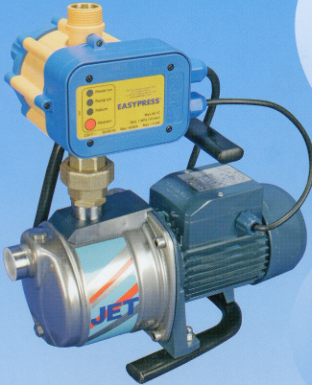
ISKU-JET 2 RS